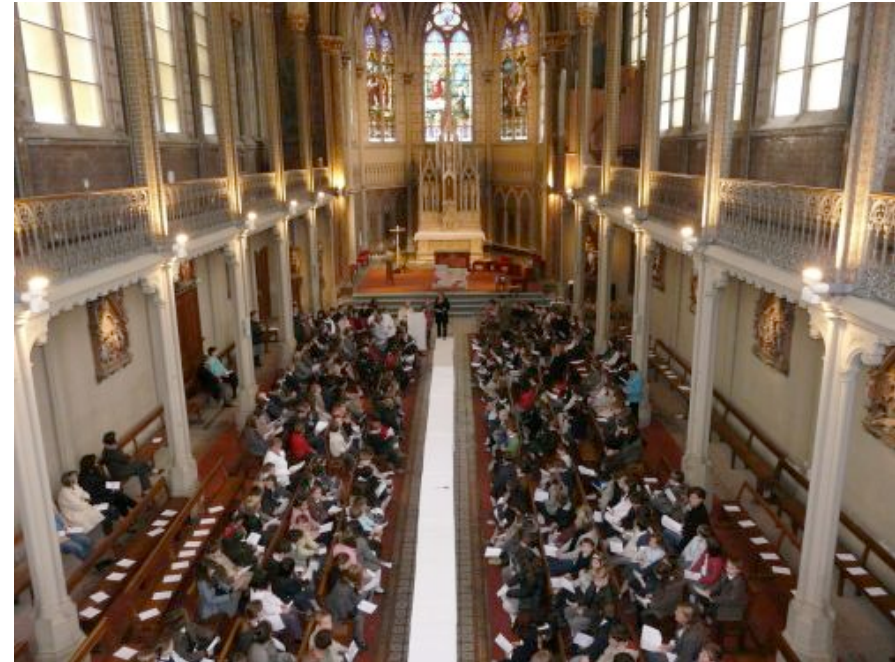
Messe du jeudi Saint avec les élèves du primaire