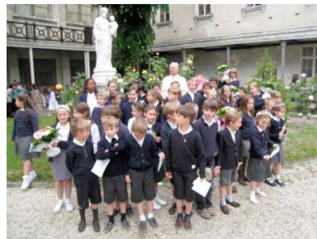
Premiers communions, en 2008