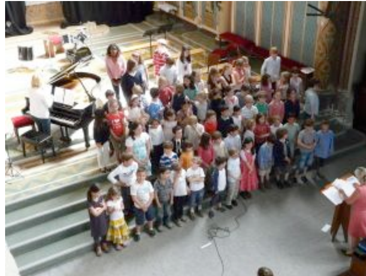
Répétition en vue d'une soirée musicale