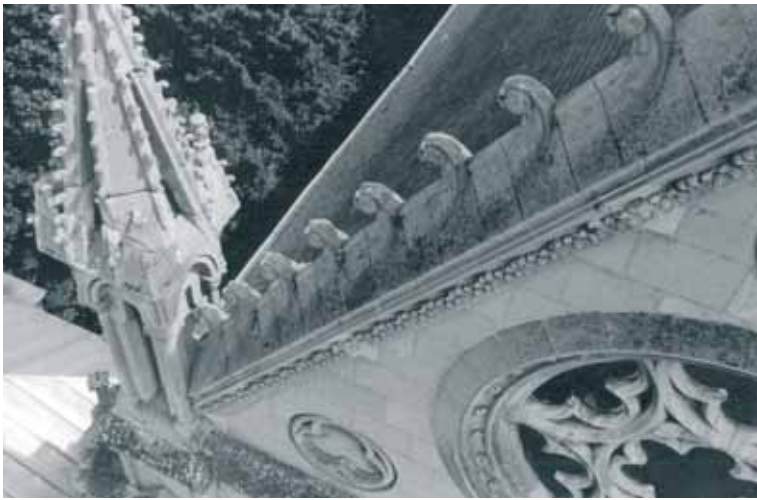
Les corniches de la façade ont connu 130 ans de foi, de célébrations, de deuils, de guerres, de concerts...

Plusieurs messes rassemblent petits et grands pour célébrer la naissance du Christ.