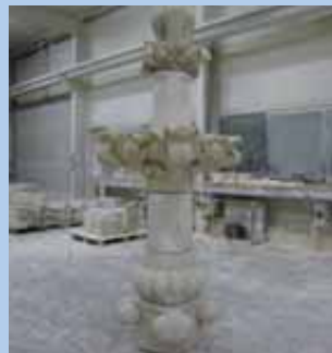
D'une hauteur de 3,50 mètres, le fleuron a été restauré en atelier avant d'être reposé au sommet de la façade fin juillet