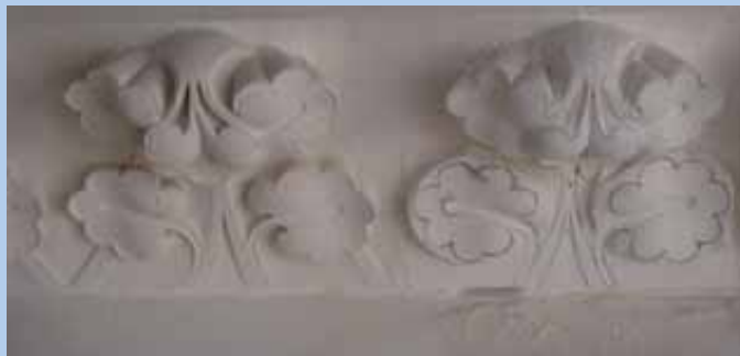
Pour retrouver leur forme d'origine, les pierres sont sculptées sur place