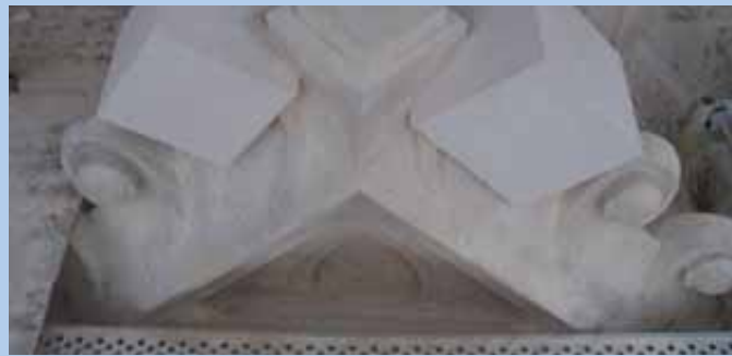
10 mètres cubes de pierres ont été posés sur la façade avant d'être taillés sur place

Revivez les principales étapes des travaux en images !