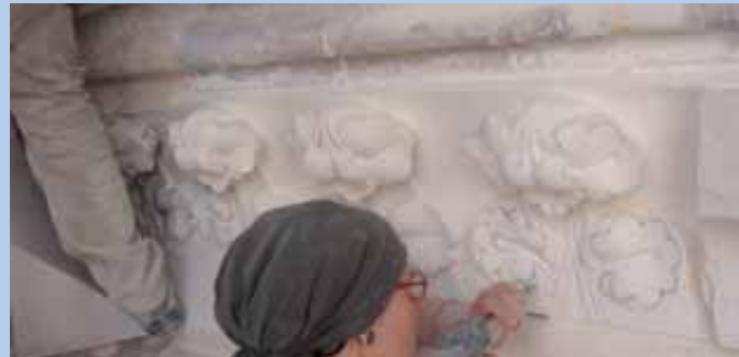
Pour l'entreprise de taille de pierre et de sculpture Léon-Noël , la restauration de la façade de la rue de Venise représente près de 8 000 heures de travail, soit 8 salariés à temps-plein pendant 6 mois !